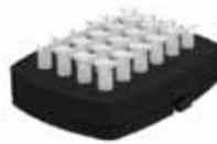
24×1.5ml 离心管 订单号：EY0708