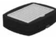
96 微孔板 订单号：EY0709